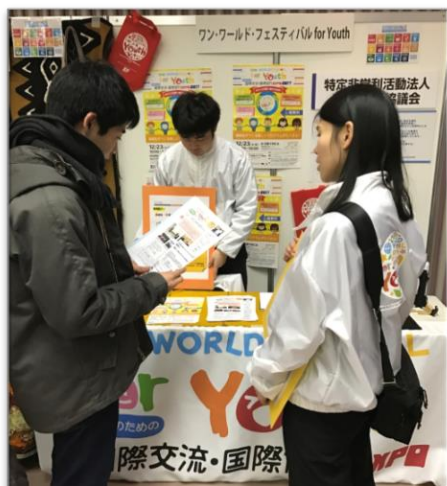
ワン・ワールド・フェスティバルでの ブース出展の様子(ワン・ワールド・フェスティバル for Youth ブース) (2018/2/4~2/5)

ブース出展においては、高校生ボランティアリーダー研修参加者(人材育成事業)がブースに立ち、積極的に活動紹介をおこなった